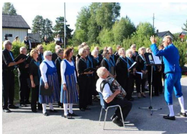
Grue Finnskog musikk – korps og sangkor