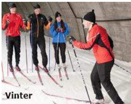
Torsby ski tunell