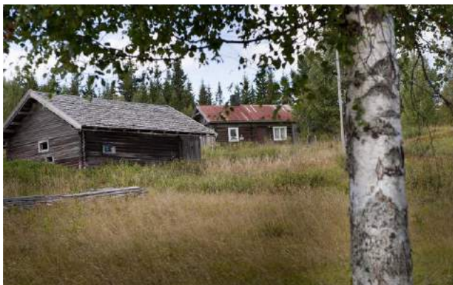
Nedre Berget, Våler Finnskog.